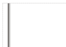
vzor - A linky

1. Bílé samolepící obálky C6 (16 x 11,5 cm) - viz vzory - A, B, C: 700,- Kč / 1.000 ks