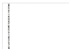
vzor - B ornament